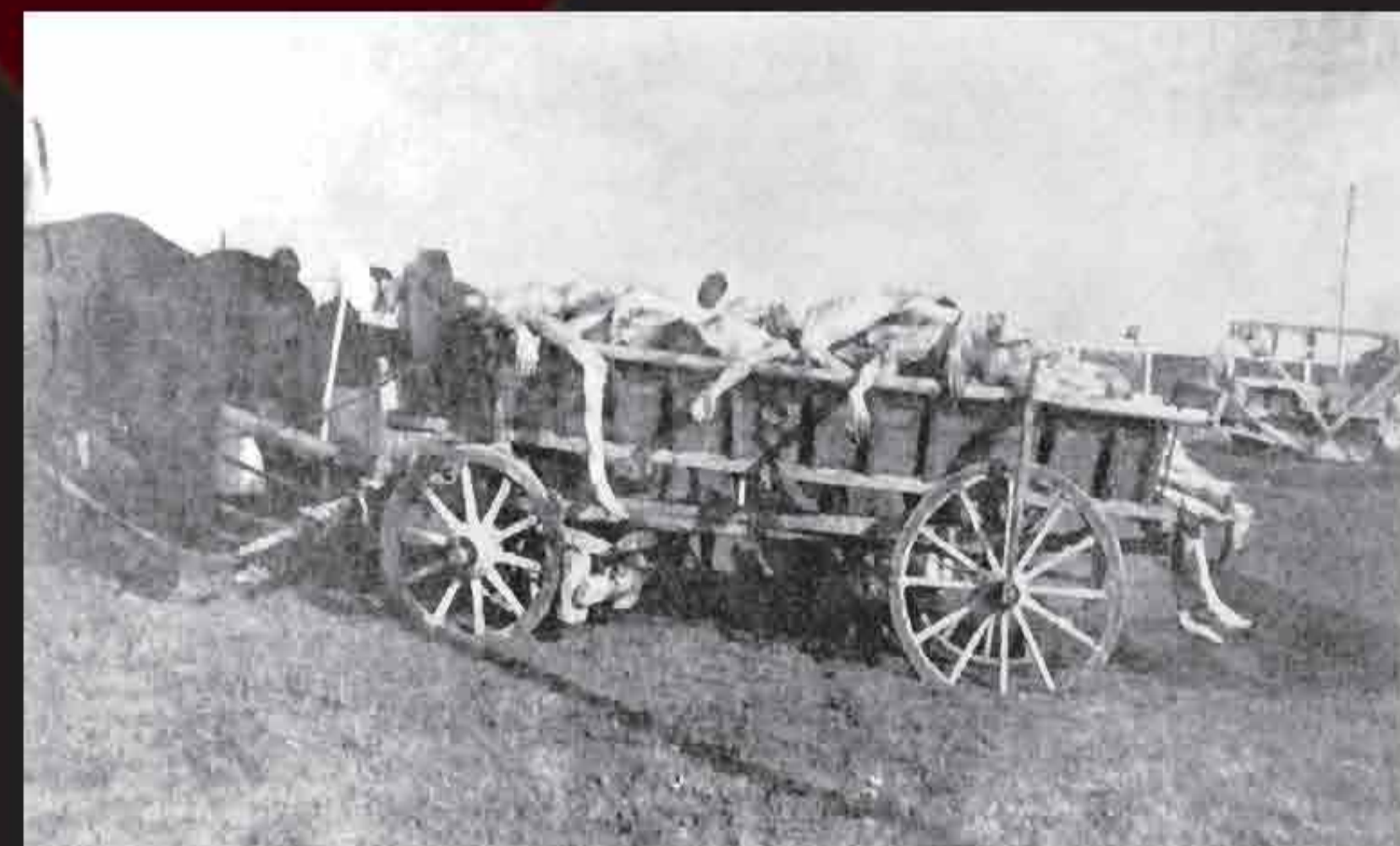
Disposal of corpses at Auschwitz-Birkenau.

BRUTAL AND DEHUMANIZING, THE CONCENTRATION CAMP SYSTEM'S main product was death. For those fit enough to work, their misfortune was slave labor, where murder occurred through work. The cycle of the day in such camps was work, hunger, and pain, always in the shadow of the sadistic violence of guards and instant execution for the slightest infraction.