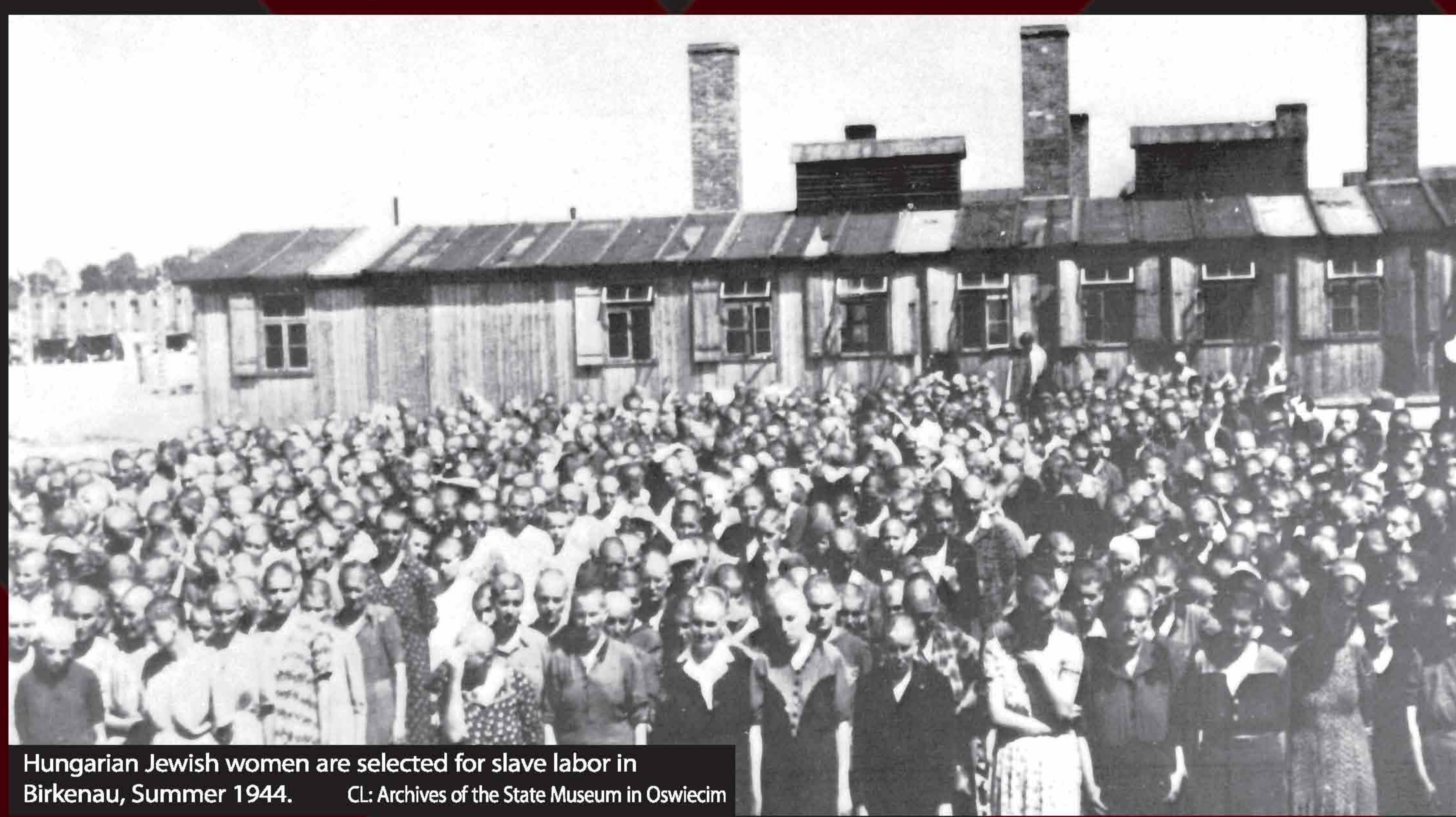
Hungarian Jewish women are selected for slave labor in Birkenau, Summer 1944.