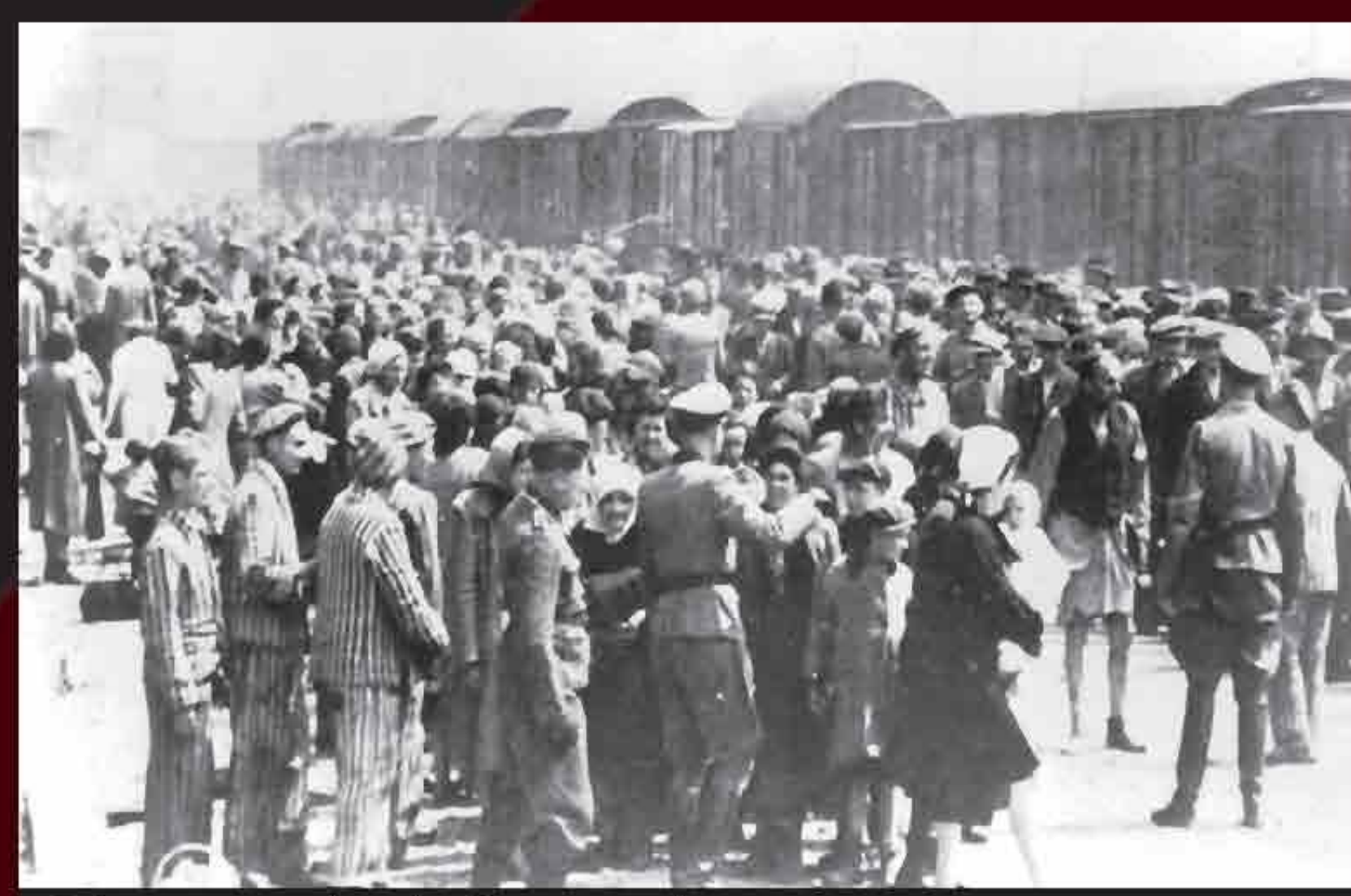
Selection on the platform at Birkenau.